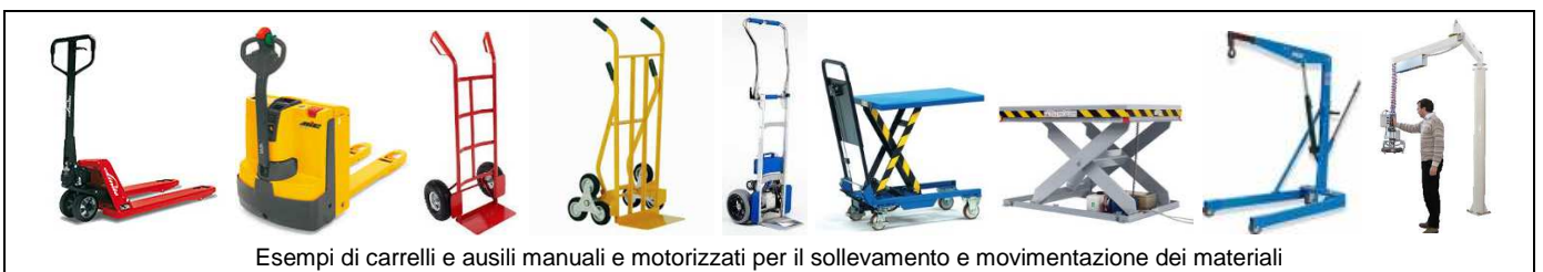
Esempi di carrelli e ausili manuali e motorizzati per il sollevamento e movimentazione dei materiali